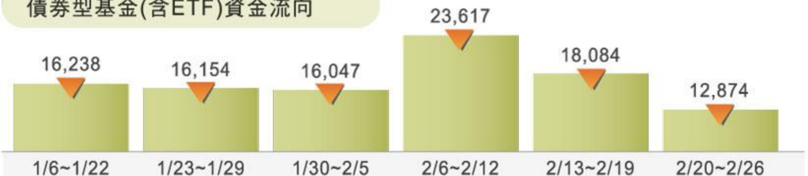
債券型基金(含ETF)資金流向

*單位：百萬美元。截至2020年2月26日。債券型合計為高收益債、新興市場債、投資等級債、市政債、MBS、政府債等各類債券型基金和ETF加總。